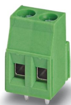
L'illustration représente une version 2 pôles de l'article

Borne de circuit imprimé, intensité nominale: 24 A, tension de référence (III/2): 400 V, section nominale: 2,5 mm 2 , nombre de potentiels: 3, nombre de rangées: 1, nombre de pôles par rangée: 3, gamme d'articles: MKDSN 2,5, pas: 5,08 mm, type de raccordement: Raccordement vissé avec bague, surface d'attaque des vis: H1L Philipps-Recess avec fente longitudinale, montage: Soudage à la vague, sens d'enfichage conducteur/circuit imprimé: 0 °, coloris: vert, Disposition des broches: Brochage linéaire, Longueur de broche [P]: 3,5 mm, nombre de picots par potentiel: 1, type de conditionnement: emballé dans un carton