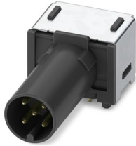
Porte-contacts, 5-pôles, Connecteur mâle, coudé, M12, A-codage, Raccordement soudé THR

Veillez tenir compte du fait que les données affichées dans ce document PDF proviennent de notre catalogue en ligne. Vous trouverez les données complètes dans la documentation utilisateur. Nos conditions générales d'utilisation des téléchargements sont applicables.