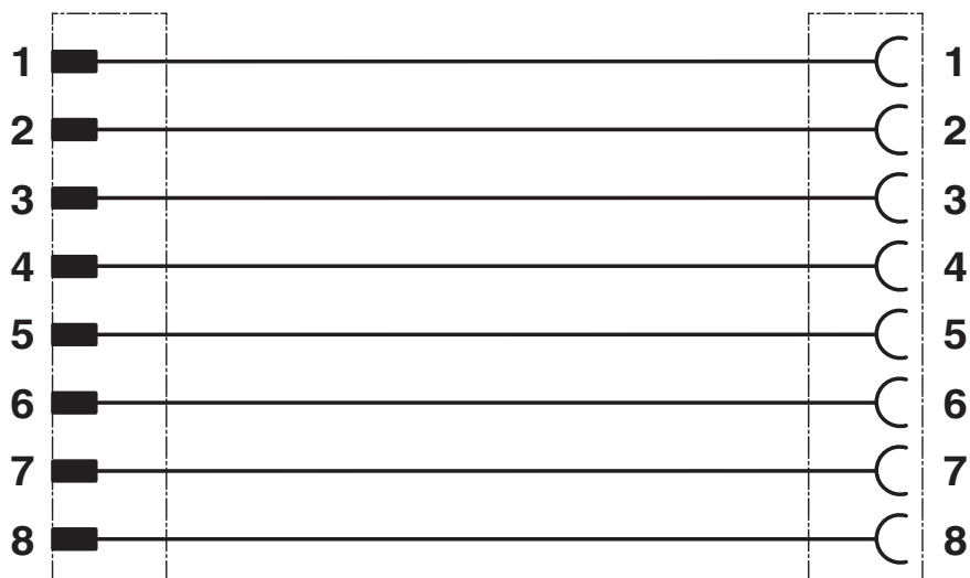
Schéma de connexion

Disposition des contacts des connecteurs M12 mâles et femelles