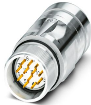
La figure représente la version de produit 12 pôles

Veillez tenir compte du fait que les données affichées dans ce document PDF proviennent de notre catalogue en ligne. Vous trouverez les données complètes dans la documentation utilisateur. Nos conditions générales d'utilisation des téléchargements sont applicables.