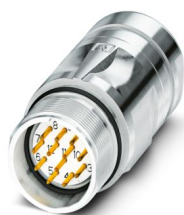
La figure représente la version de produit 12 pôles

Veillez tenir compte du fait que les données affichées dans ce document PDF proviennent de notre catalogue en ligne. Vous trouverez les données complètes dans la documentation utilisateur. Nos conditions générales d'utilisation des téléchargements sont applicables.