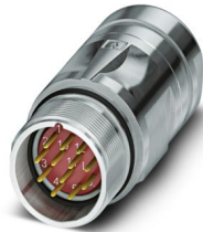
La figure représente la version de produit 12 pôles

Veillez tenir compte du fait que les données affichées dans ce document PDF proviennent de notre catalogue en ligne. Vous trouverez les données complètes dans la documentation utilisateur. Nos conditions générales d'utilisation des téléchargements sont applicables.