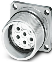
La figure représente la version de produit 6 pôles

Veillez tenir compte du fait que les données affichées dans ce document PDF proviennent de notre catalogue en ligne. Vous trouverez les données complètes dans la documentation utilisateur. Nos conditions générales d'utilisation des téléchargements sont applicables.