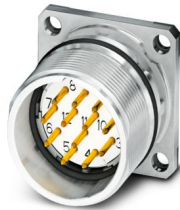
La figure représente la version de produit 12 pôles

Veillez tenir compte du fait que les données affichées dans ce document PDF proviennent de notre catalogue en ligne. Vous trouverez les données complètes dans la documentation utilisateur. Nos conditions générales d'utilisation des téléchargements sont applicables.