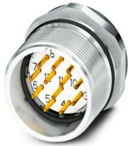
La figure illustre la variante produit avec contacts à souder

Veillez tenir compte du fait que les données affichées dans ce document PDF proviennent de notre catalogue en ligne. Vous trouverez les données complètes dans la documentation utilisateur. Nos conditions générales d'utilisation des téléchargements sont applicables.