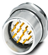
La figure représente la version de produit 12 pôles

Veuillez tenir compte du fait que les données affichées dans ce document PDF proviennent de notre catalogue en ligne. Vous trouverez les données complètes dans la documentation utilisateur. Nos conditions générales d'utilisation des téléchargements sont applicables.