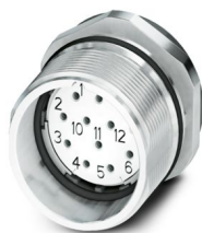
La figure représente la version de produit 12 pôles

Veillez tenir compte du fait que les données affichées dans ce document PDF proviennent de notre catalogue en ligne. Vous trouverez les données complètes dans la documentation utilisateur. Nos conditions générales d'utilisation des téléchargements sont applicables.