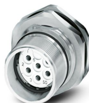
La figure représente la version de produit 6 pôles

Veillez tenir compte du fait que les données affichées dans ce document PDF proviennent de notre catalogue en ligne. Vous trouverez les données complètes dans la documentation utilisateur. Nos conditions générales d'utilisation des téléchargements sont applicables.