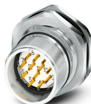
La figure représente la version de produit 12 pôles

Veillez tenir compte du fait que les données affichées dans ce document PDF proviennent de notre catalogue en ligne. Vous trouverez les données complètes dans la documentation utilisateur. Nos conditions générales d'utilisation des téléchargements sont applicables.