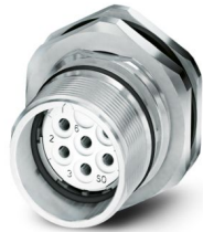
La figure représente la version de produit 6 pôles

Veillez tenir compte du fait que les données affichées dans ce document PDF proviennent de notre catalogue en ligne. Vous trouverez les données complètes dans la documentation utilisateur. Nos conditions générales d'utilisation des téléchargements sont applicables.