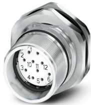
La figure représente la version de produit 12 pôles

Veillez tenir compte du fait que les données affichées dans ce document PDF proviennent de notre catalogue en ligne. Vous trouverez les données complètes dans la documentation utilisateur. Nos conditions générales d'utilisation des téléchargements sont applicables.