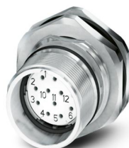
La figure représente la version de produit 12 pôles

Veillez tenir compte du fait que les données affichées dans ce document PDF proviennent de notre catalogue en ligne. Vous trouverez les données complètes dans la documentation utilisateur. Nos conditions générales d'utilisation des téléchargements sont applicables.