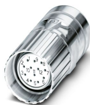
La figure représente la version de produit 12 pôles

Veillez tenir compte du fait que les données affichées dans ce document PDF proviennent de notre catalogue en ligne. Vous trouverez les données complètes dans la documentation utilisateur. Nos conditions générales d'utilisation des téléchargements sont applicables.