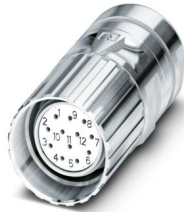
La figure représente la version de produit 12 pôles

Veillez tenir compte du fait que les données affichées dans ce document PDF proviennent de notre catalogue en ligne. Vous trouverez les données complètes dans la documentation utilisateur. Nos conditions générales d'utilisation des téléchargements sont applicables.