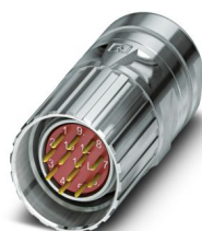
La figure représente la version de produit 12 pôles

Veillez tenir compte du fait que les données affichées dans ce document PDF proviennent de notre catalogue en ligne. Vous trouverez les données complètes dans la documentation utilisateur. Nos conditions générales d'utilisation des téléchargements sont applicables.