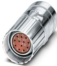
La figure représente la version de produit 12 pôles

Veillez tenir compte du fait que les données affichées dans ce document PDF proviennent de notre catalogue en ligne. Vous trouverez les données complètes dans la documentation utilisateur. Nos conditions générales d'utilisation des téléchargements sont applicables.