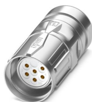
La figure représente la version de produit 6 pôles

Veuillez tenir compte du fait que les données affichées dans ce document PDF proviennent de notre catalogue en ligne. Vous trouverez les données complètes dans la documentation utilisateur. Nos conditions générales d'utilisation des téléchargements sont applicables.