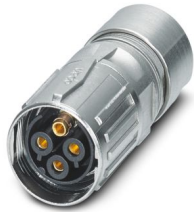
L'illustration représente la version à 4 pôles

Veillez tenir compte du fait que les données affichées dans ce document PDF proviennent de notre catalogue en ligne. Vous trouverez les données complètes dans la documentation utilisateur. Nos conditions générales d'utilisation des téléchargements sont applicables.