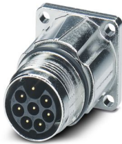
La figure représente la version de produit 8 pôles (7+PE)

Veillez tenir compte du fait que les données affichées dans ce document PDF proviennent de notre catalogue en ligne. Vous trouverez les données complètes dans la documentation utilisateur. Nos conditions générales d'utilisation des téléchargements sont applicables.