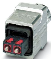
Connecteur mâle SCRJ Push-Pull, IP67

Veillez tenir compte du fait que les données affichées dans ce document PDF proviennent de notre catalogue en ligne. Vous trouverez les données complètes dans la documentation utilisateur. Nos conditions générales d'utilisation des téléchargements sont applicables.