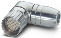
La figure représente la version de produit 12 pôles

Veillez tenir compte du fait que les données affichées dans ce document PDF proviennent de notre catalogue en ligne. Vous trouverez les données complètes dans la documentation utilisateur. Nos conditions générales d'utilisation des téléchargements sont applicables.