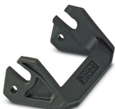
Étrier longitudinal pour boîtier B10, HC-EVO....AL et HC-STA....AL

Veillez tenir compte du fait que les données affichées dans ce document PDF proviennent de notre catalogue en ligne. Vous trouverez les données complètes dans la documentation utilisateur. Nos conditions générales d'utilisation des téléchargements sont applicables.