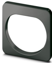
CHARX connect basic, Type 2, Cadre, Accessoires, Montage sur face avant, Filetage M5, boîtiers: noir, à fixer sur les prises côté infrastructure, Sans logo, CEI 62196-2

Veillez tenir compte du fait que les données affichées dans ce document PDF proviennent de notre catalogue en ligne. Vous trouverez les données complètes dans la documentation utilisateur. Nos conditions générales d'utilisation des téléchargements sont applicables.