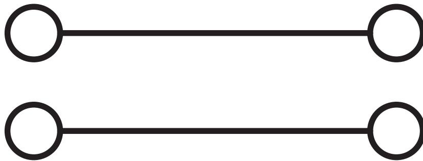
Schéma de connexion