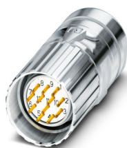
La figure représente la version de produit 12 pôles

Veillez tenir compte du fait que les données affichées dans ce document PDF proviennent de notre catalogue en ligne. Vous trouverez les données complètes dans la documentation utilisateur. Nos conditions générales d'utilisation des téléchargements sont applicables.