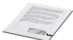
Lingette de nettoyage des fibres

https://www.phoenixcontact.com/fr/produits/1414104