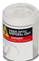
Conteneur à fibres

https://www.phoenixcontact.com/fr/produits/1414102