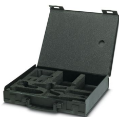
Mallette de rechange, vide

https://www.phoenixcontact.com/fr/produits/1414095