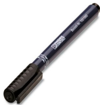
Crayon de marquage

https://www.phoenixcontact.com/fr/produits/1414105