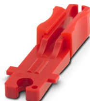
Support pour fils

https://www.phoenixcontact.com/fr/produits/1414096