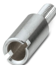
Bornier de test, coloris: argenté

Veillez tenir compte du fait que les données affichées dans ce document PDF proviennent de notre catalogue en ligne. Vous trouverez les données complètes dans la documentation utilisateur. Nos conditions générales d'utilisation des téléchargements sont applicables.