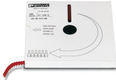
Abbildung zeigt die Variante AI 1,5 - 8, in der Farbe rot

Aderendhülse, Länge Kontaktbereich: 8 mm, Hülsenlänge: 14 mm, Farbe: rot