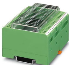
Diodenmodul, mit 17 Dioden, einzeln beschaltbar, Diodentyp 1N 4007

Bitte beachten Sie, dass die in diesem PDF-Dokument angezeigten Daten aus unserem Online-Katalog generiert wurden. Bitte finden Sie die vollständigen Daten in der Benutzer-Dokumentation. Es gelten unsere Allgemeinen Nutzungsbedingungen für Downloads.