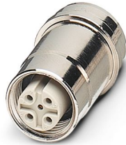
Gerätesteckverbinder Hinterwand, Universal, 5-polig, Buchse, gerade, M12, A-Kodierung, Lötstifte

Bitte beachten Sie, dass die in diesem PDF-Dokument angezeigten Daten aus unserem Online-Katalog generiert wurden. Bitte finden Sie die vollständigen Daten in der Benutzer-Dokumentation. Es gelten unsere Allgemeinen Nutzungsbedingungen für Downloads.