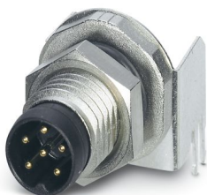
Gerätesteckverbinder Hinterwand, 6-polig, Stift, gewinkelt, M8, A-Kodierung, Wellenlöten

Bitte beachten Sie, dass die in diesem PDF-Dokument angezeigten Daten aus unserem Online-Katalog generiert wurden. Bitte finden Sie die vollständigen Daten in der Benutzer-Dokumentation. Es gelten unsere Allgemeinen Nutzungsbedingungen für Downloads.