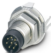
Gerätesteckverbinder Hinterwand, Universal, 8-polig, Stift, gerade, M8, A-Kodierung, Wellenlöten

Bitte beachten Sie, dass die in diesem PDF-Dokument angezeigten Daten aus unserem Online-Katalog generiert wurden. Bitte finden Sie die vollständigen Daten in der Benutzer-Dokumentation. Es gelten unsere Allgemeinen Nutzungsbedingungen für Downloads.