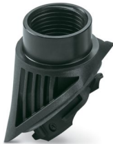
Gewindeadapter aus Kunststoff mit Bajonettverschluss, für EVO-Gehäuseserie B, NPT 3/4"-Gewinde

Bitte beachten Sie, dass die in diesem PDF-Dokument angezeigten Daten aus unserem Online-Katalog generiert wurden. Bitte finden Sie die vollständigen Daten in der Benutzer-Dokumentation. Es gelten unsere Allgemeinen Nutzungsbedingungen für Downloads.