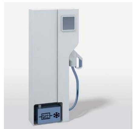
Anwendungsbeispiel 2: autarke Ladesäule