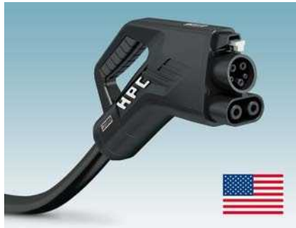
CCS HPC Typ 1 für Nordamerika