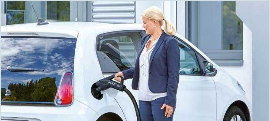
Dank HPC nach wenigen Minuten weiterfahren

Fahrer und Hersteller von Elektrofahrzeugen fordern immer kürzere Ladezeiten, da letztere wesentlich zur Alltagstauglichkeit und Akzeptanz der Elektromobilität beitragen. Mit High Power Charging (HPC) haben wir eine Ladetechnologie entwickelt, die den Akku in nur drei bis fünf Minuten für 100 km Reichweite lädt. Herzstück ist ein Hochleistungs-Ladestecker mit intelligenter Kühlung, der einen Ladestrom von 500 A erlaubt.