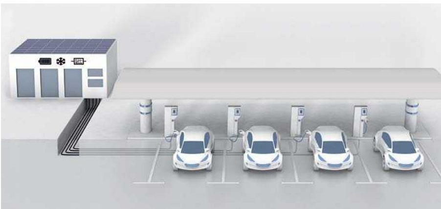
Anwendungsbeispiel 1: Stromtankstelle mit mehreren Ladesäulen

Zur Realisierung Ihrer individuellen Lösung sprechen Sie uns bitte an.