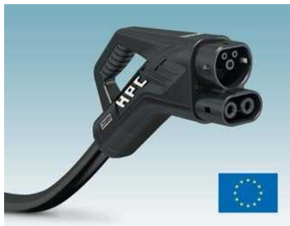
CCS HPC Typ 2 für Europa