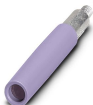
Presa multipla di prova, numero poli: 1, colore: viola

Si prega di notare che i dati visualizzati in questo PDF sono stati generati dal nostro catalogo online. I dati completi sono disponibili nella documentazione per l'utente. Si applicano le condizioni generali di utilizzo per i download.