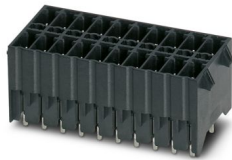
La figura illustra la variante a 10 poli con 20 contatti

Preso base per circuiti stampati, sezione nominale: 1,5 mm 2 , colore: nero, corrente nominale: 8 A, tensione di dimensionamento (III/2): 160 V, superficie contatti: Sn, tipo di connessione del contatto: Spina, numero dei potenziali: 24, numero di file: 2, numero poli: 12, numero di connessioni: 24, serie di prodotti: MCDNV 1,5/..-G1-RN-THR, passo: 3,5 mm, montaggio: Saldatura TTHR / ad onde, layout pin: Pinning lineare, lunghezza pin [P]: 1,4 mm, numero di pin di saldatura per potenziale: 1, sistema di spine: COMBICON FMC 1,5 - MCDN 1,5, Orientamento pin d'inserimento: Standard, bloccaggio: Bloccaggio a scatto, tipo di fissaggio: Linguetta a innesto, tipo di confezione: confezionato nel cartone, Articolo con linguetta a innesto. La lunghezza pin è pari a 14 mm. Le informazioni per l'utente e le proposte di progettazione per la tecnologia Through Hole Reflow sono indicate nella pagina: "Download"