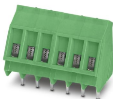
La figura mostra una versione a 6 poli

Morsetto circuito stampato, corrente nominale: 24 A, tensione di dimensionamento (III/2): 400 V, sezione nominale: 2,5 mm 2 , numero dei potenziali: 15, numero di file: 1, numero di poli per fila: 15, serie di prodotti: SMKDS 3, passo: 5,08 mm, tipo di connessione: Connessione a vite con gabbia, forma di attacco delle viti: L Fessura longitudinale, montaggio: Saldatura a onde, direzione di collegamento conduttore/scheda: 55 °, colore: verde, Layout Pin: Pinning lineare, Lunghezza pin [P]: 4,5 mm, numero di pin di saldatura per potenziale: 1, tipo di confezione: confezionato nel cartone