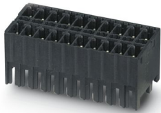
La figura illustra la variante a 10 poli con 20 contatti

Preso base per circuiti stampati, sezione nominale: 1,5 mm 2 , colore: nero, corrente nominale: 8 A, tensione di dimensionamento (III/2): 160 V, superficie contatti: Sn, tipo di connessione del contatto: Spina, numero dei potenziali: 12, numero di file: 2, numero poli: 6, numero di connessioni: 12, serie di prodotti: MCDNV 1,5/..-G1-THR, passo: 3,81 mm, montaggio: Saldatura TTHR / ad onde, layout pin: Pinning lineare, lunghezza pin [P]: 1,4 mm, numero di pin di saldatura per potenziale: 1, sistema di spine: COMBICON FMC 1,5 - MCDN 1,5, Orientamento pin d'inserimento: Standard, bloccaggio: assente, tipo di fissaggio: assente, tipo di confezione: confezionato nel cartone, La lunghezza pin è pari a 1,4 mm. Le informazioni per l'utente e le proposte di progettazione per la tecnologia Through Hole Reflow sono indicate nella pagina: "Download".