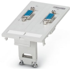
Piastra dati frontale con inserti portacontatti, plastica, 2x D-SUB 9, femmina/maschio

Si prega di notare che i dati visualizzati in questo PDF sono stati generati dal nostro catalogo online. I dati completi sono disponibili nella documentazione per l'utente. Si applicano le condizioni generali di utilizzo per i download.