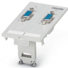
Piastra dati frontale con inserti portacontatti, plastica, 2x D-SUB 9, femmina/maschio

Si prega di notare che i dati visualizzati in questo PDF sono stati generati dal nostro catalogo online. I dati completi sono disponibili nella documentazione per l'utente. Si applicano le condizioni generali di utilizzo per i download.