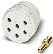
La figura mostra la versione a 6 poli

Si prega di notare che i dati visualizzati in questo PDF sono stati generati dal nostro catalogo online. I dati completi sono disponibili nella documentazione per l'utente. Si applicano le condizioni generali di utilizzo per i download.