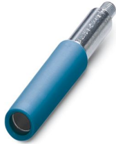
Prüfsteckerbuchse, Polzahl: 1, Farbe: blau

Bitte beachten Sie, dass die in diesem PDF-Dokument angezeigten Daten aus unserem Online-Katalog generiert wurden. Bitte finden Sie die vollständigen Daten in der Benutzer-Dokumentation. Es gelten unsere Allgemeinen Nutzungsbedingungen für Downloads.