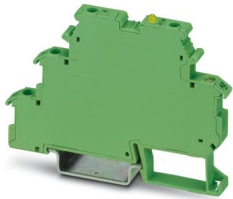
Eingabe-Solid-State-Relaisklemme, Eingang: 24 V DC, Ausgang: 3-48 V DC/100 mA, Klemmenbreite 6,2 mm

Bitte beachten Sie, dass die in diesem PDF-Dokument angezeigten Daten aus unserem Online-Katalog generiert wurden. Bitte finden Sie die vollständigen Daten in der Benutzer-Dokumentation. Es gelten unsere Allgemeinen Nutzungsbedingungen für Downloads.