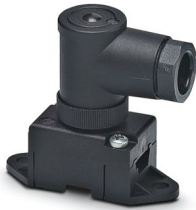
AS-Interface Verteiler in Schutzart IP67 für 1 Flachleitung, 2-polig, mit Schraubanschluss, gewinkelt

Bitte beachten Sie, dass die in diesem PDF-Dokument angezeigten Daten aus unserem Online-Katalog generiert wurden. Bitte finden Sie die vollständigen Daten in der Benutzer-Dokumentation. Es gelten unsere Allgemeinen Nutzungsbedingungen für Downloads.