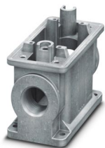
HEAVYCON ADVANCE Sockelgehäuse B10, für Schraubverriegelung M6, seewasserbeständiges Aluminium, mit Gewinde 2x M25, ohne Oberfläche

Bitte beachten Sie, dass die in diesem PDF-Dokument angezeigten Daten aus unserem Online-Katalog generiert wurden. Bitte finden Sie die vollständigen Daten in der Benutzer-Dokumentation. Es gelten unsere Allgemeinen Nutzungsbedingungen für Downloads.