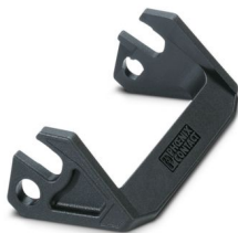
Ersatzlängsbügel für HEAVYCON-EVO-Gehäuse der Bauform B16, PA

Bitte beachten Sie, dass die in diesem PDF-Dokument angezeigten Daten aus unserem Online-Katalog generiert wurden. Bitte finden Sie die vollständigen Daten in der Benutzer-Dokumentation. Es gelten unsere Allgemeinen Nutzungsbedingungen für Downloads.