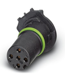
Kontaktträger, 5-polig, Buchse, gerade, M12, A-Kodierung, THR-Lötanschluss, Artikel ist bleifrei nach RoHS II ohne Ausnahme 6c (Pb < 0,1 %)

Bitte beachten Sie, dass die in diesem PDF-Dokument angezeigten Daten aus unserem Online-Katalog generiert wurden. Bitte finden Sie die vollständigen Daten in der Benutzer-Dokumentation. Es gelten unsere Allgemeinen Nutzungsbedingungen für Downloads.